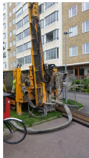
Bergbormaskin under borring med foderrör